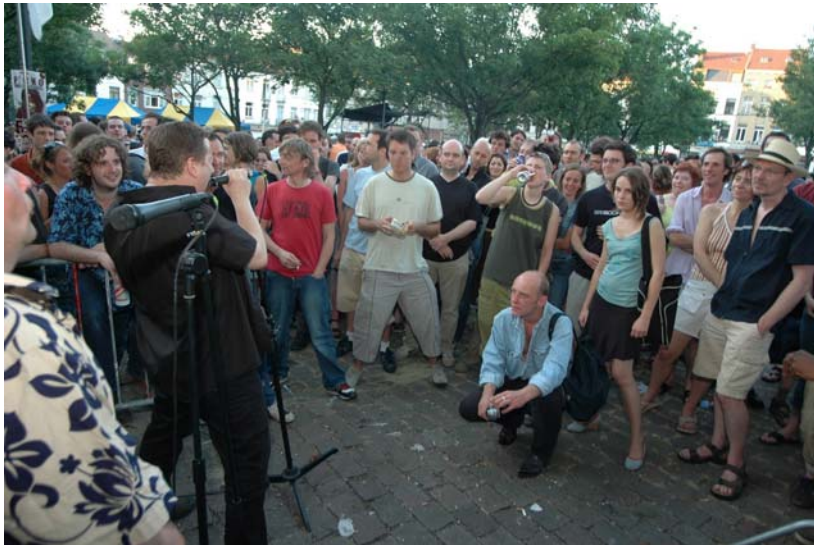
Riot-Gig : St Gilles Fêtes de la musique.