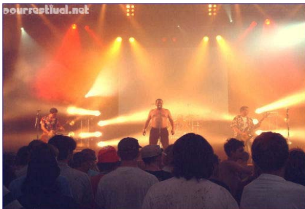
Concert Dourfestival 2005